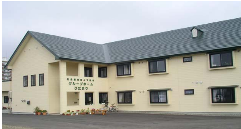
グループホームひだまり外観